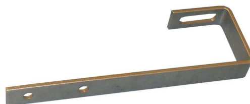
Schrägdach Montage-Set – flache Abdeckung