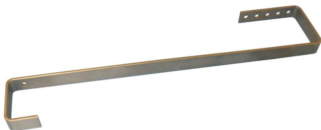
Schrägdach Montage-Set - Dachziegel